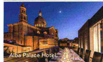
Alba Palace Hotel.

Ritaglio stampa ad uso esclusivo del destinatario, non riproducibile.