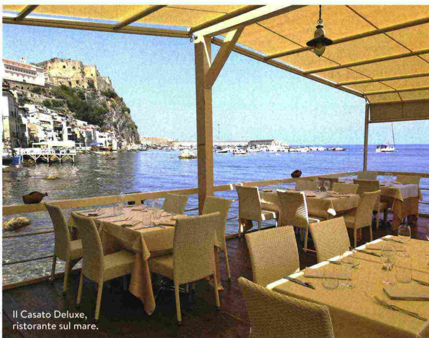
Il Casato Deluxe, ristorante sul mare.

Ritaglio stampa ad uso esclusivo del destinatario, non riproducibile.