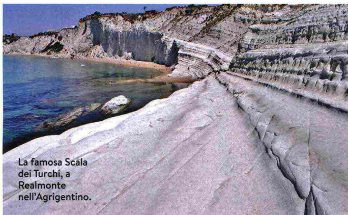
La famosa Scala dei Turchi, a Realmonte nell'Agrigentino.