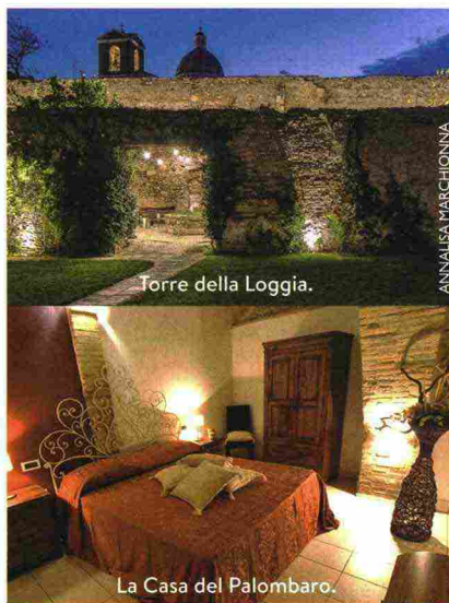
Torre della Loggia.