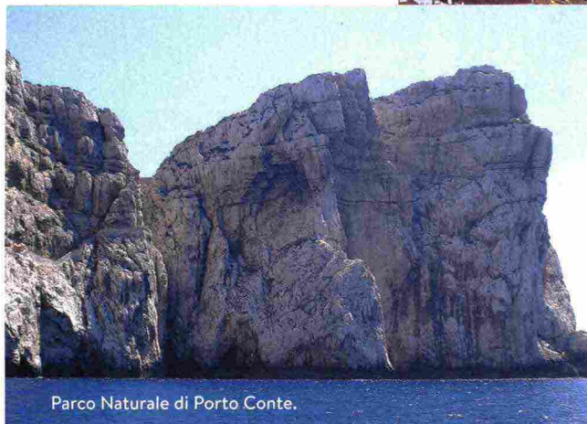
Parco Naturale di Porto Conte.