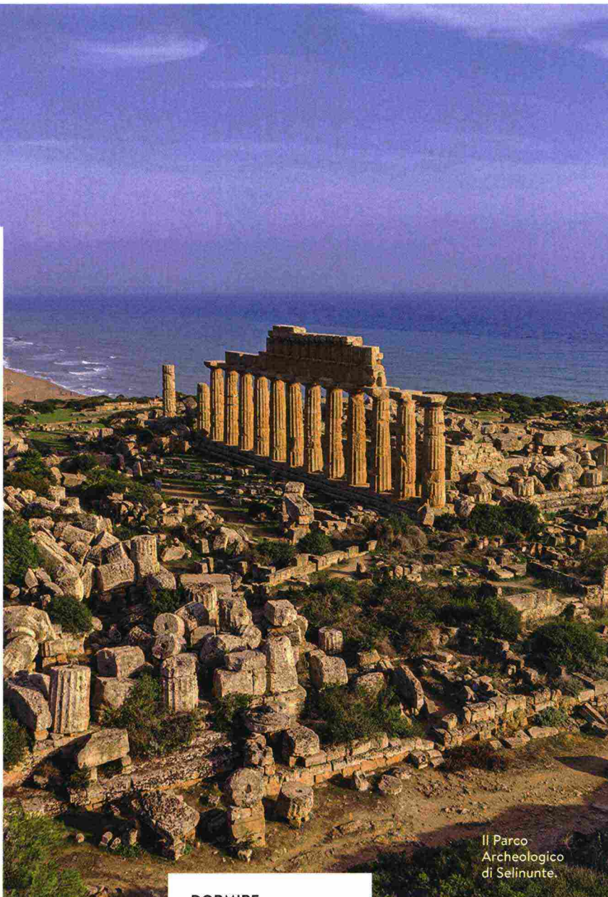
Il Parco Archeologico di Selinunte.

Tra il Parco Archeologico di Selinunte (Tp) e le Mura Timoleoniche di Gela (Cl) ci sono 150 km di coste scolpite da falesie di marna bianca, necropoli, oasi naturali e borghi-bomboniera che hanno visto nascere Sciascia, Pirandello e Camilleri. Prima tappa la spiaggia dell'Acropoli a Selinunte , poi il "Menfishire" distretto vitivinicolo dove sorvegliare un calice di Grillo e Nero d'Avola nella tenuta Mandarossa ( mandrarossa.it ). Il museo archeologico e la Valle dei Templi di Agrigento meritano un'intera giornata (dal 28/07 al 18/09 c'è il Festival il Mito con Irama ed Elisa) mentre i "Sicani", villaggi dell'entroterra come Sutura e Sambuca di Sicilia, sfoggiano quartieri saraceni e vicoli medievali ( visitvalledei Templi.it , visitselinunte.com ). Ci sono poi la Riserva della Foce del Fiume Platani , oasi dove tra carrubi e palme nane sorgeva la città greca di Eraclea Minoa con il suo Antiquarium e il Teatro Greco (fine del V sec. a.C.) e quella di Torre Salsa , tutta dune e rare erbe medicinali, dove nidificano le tartarughe Caretta caretta. La star della zona è la Scala dei Turchi , falesia color borotalco.