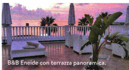
B&B Eneide con terrazza panoramica.

A definire "viola" i 35 km di costa calabrese tra Palmi (Rc) e Villa San Giovanni (Rc) , è stato Platone, stregato dalle sfumature della macchia mediterranea che si riflettono al tramonto nel blu del mare. Si parte da Palmi , soprannominata "il balcone sul Tirreno" per la posizione arrampicata sul Monte Sant'Elia , si visita la Concattedrale di San Nicola e la sua Torre dell'Orologio (alta 40 m), poi ci si tuffa nella spiaggia Ulivarella che vanta un isolotto roccioso con un olivo secolare. La selvaggia Scilla , decantata da Omero nell' Odissea , conquista per il lungo litorale color panna: il tratto più scenografico va dal lido di Marina Grande al Castello Ruffo di Calabria. La chicca è il borghetto di Chianalea : un dedalo di corridoi ad arco e casette lambite dall'acqua dove i pescatori gettano le canne dai balconi ( calabriastroordinaria.it ).