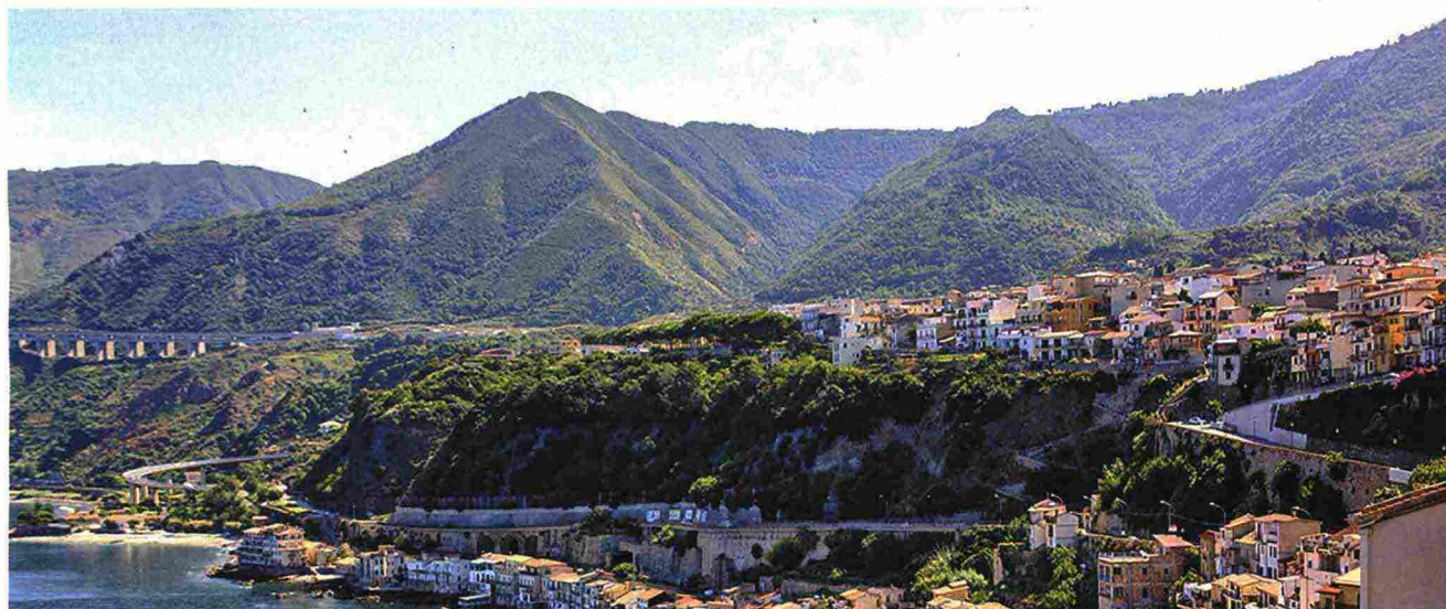
Scilla, sul promontorio all'ingresso dello Stretto di Messina.