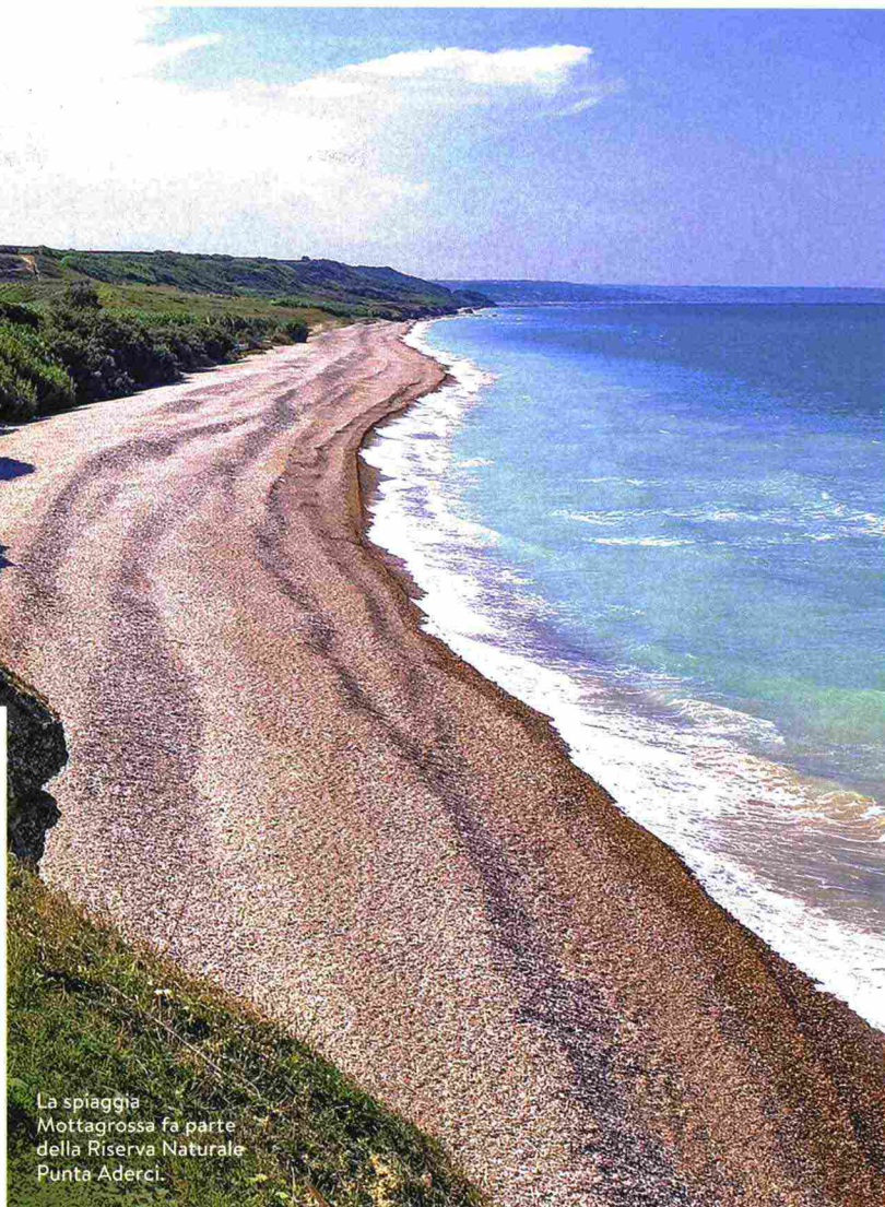
La spiaggia Mottagrossa fa parte della Riserva Naturale Punta Aderci.

Il più famoso (e antico) è il "Turchino", decantato da Gabriele D'Annunzio nel romanzo Trionfo della morte , ma nella costa abruzzese che si snoda lungo la SS 16 Adriatica, da Francavilla al Mare (Ch) a San Salvo (Ch), di trabocchi se ne ammirano più di una ventina. Oggi molti "ragni colossali", come ha descritto il Vate queste macchine da pesca su palafitte, ospitano rinomati ristoranti di pesce (come San Giacomo, Punta Fornace e Mucchiola) e sono il punto di partenza per esplorare il litorale. Due i promontori da raggiungere per un panorama da cartolina: il "Dannunziano" a San Vito Chietino e quello di Punta Aderci a Vasto , che domina l'omonima riserva naturale. Il tour delle spiagge include Punta dell'Acquabella , oasi con profumati pini e alberi di arancio, Calata Turchino a San Vito Marina, dove le sfumature dell'acqua si confondono con quelle del cielo, la selvagia Mottagrossa e quella dei Ripari di Giobbe a Ortona, abbracciata da una falesia a picco. Il borgo medievale di Rocca San Giovanni con la sua torre campanaria del XII secolo, merita una sosta per l'atmosfera sospesa nel tempo, mentre di sera si raggiunge Vasto per lo struscio tra botteghe artigiane e la romantica Loggia Ambligh , belvedere sul mare gettonato al tramonto ( turismo.abruzzo.it ).