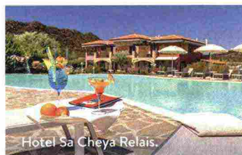
Hotel Sa Cheya Relais.

• Villa Asfodeli , Tresnuraghes (Or). In pieno centro storico, un albergo diffuso ecosostenibile con servizi e officina per chi viaggia in bici doppia b&b da 129 euro, asfodelihotel.com