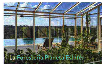
La Foresteria Planeta Estate

• La Foresteria Planeta Estate , Menfi (Ag). Wine resort vista mare, con giardino e piscina. Pacchetto "In vacanza tra i profumi del Mediterraneo" con colazione, cena di 4 portate, visita del giardino delle erbe aromatiche e cooking class, 285 euro a persona, planetaestate.it • Alba Palace Hotel , Favara (Ag). In un palazzo ottocentesco con piscina e ristorante siciliano Le Travegole, doppia b&b da 104 euro, albapalace.com